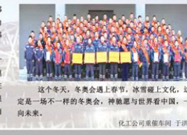
化工公司重包车间 于洪新

“功成不必在我，功成必定有我” 冬奥会的开幕式上，国旗入场仪式期间，发生这感人的一幕，升旗手庄严肃穆，目送国旗升起，同时眼角流下一行热泪，这滑着热泪的热泪让无数人动容，感同身受，他在无人注视的角落里，用一滴热泪的滚烫，表达了这一夜所有的骄傲与热爱，这也是只有中国人才懂的《泪水》，开幕式上中国各行各业先进楷模代表共同传递国旗时，民族自豪感油然而生，我们在红旗下，长在春风里，人民有信仰，而升旗手的这滴热泪，饱含了对祖国的忠诚、骄傲和自豪，滑落眼眶，滴在了我们所有中国人的心里，激起一片惊涛骇浪，那里